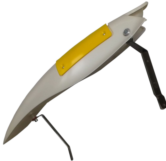
Photo vue arriere avec supports / Photo from the rear with supports