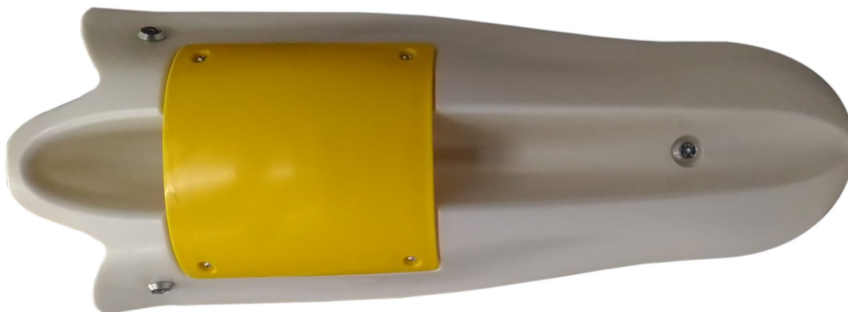
Photos vue de devant du panneau / Photo of the front of panel

Signature et tampon de l'ASN / Signature and stamp of the ASN