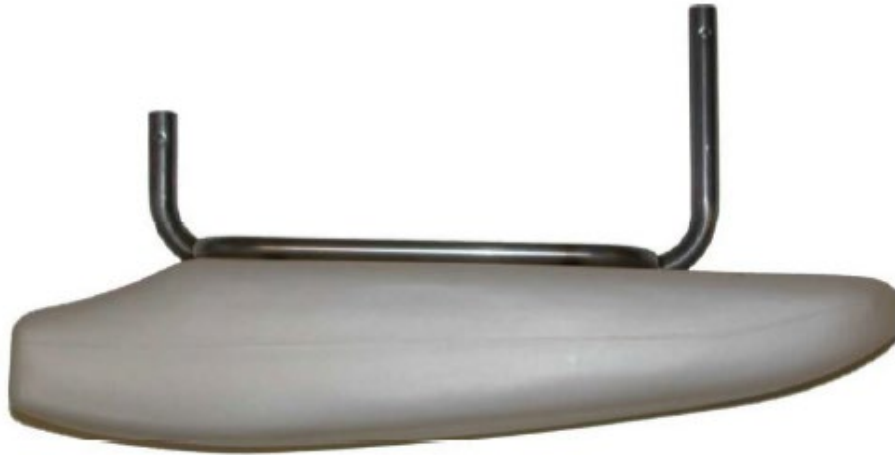
Photo vue de devant avec supports / Photo from the front with supports